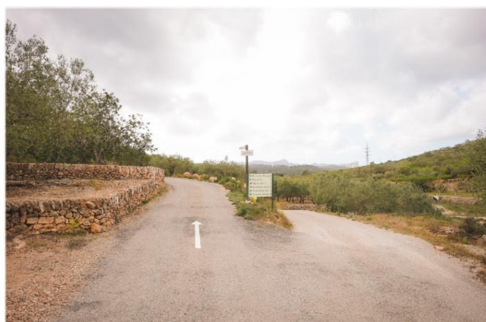
Seguim el camí sense desviar-nos