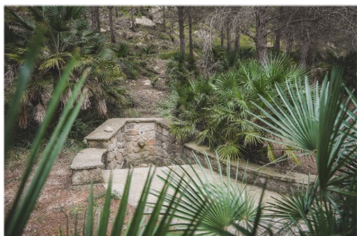
Seguim el camí sense desviar-nos fins a arribar a La Font de Tita